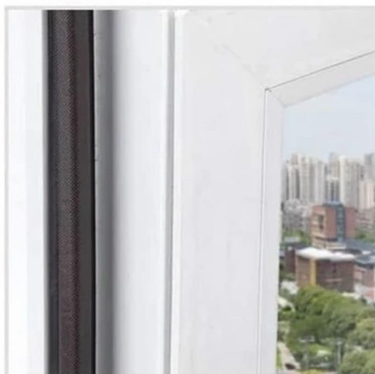
4. После установки, уплотнитель можно аккуратно разровнять руками.