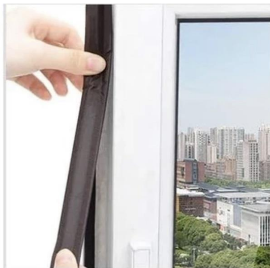
2. Отрежьте уплотнитель необходимой длины. Снимите защитную ленту с клейкой основы.