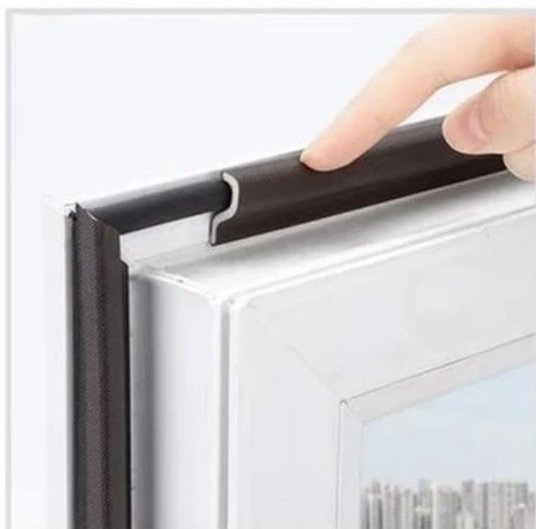
3. Плотно прижмите уплотнитель клейкой стороной к раме или створке.