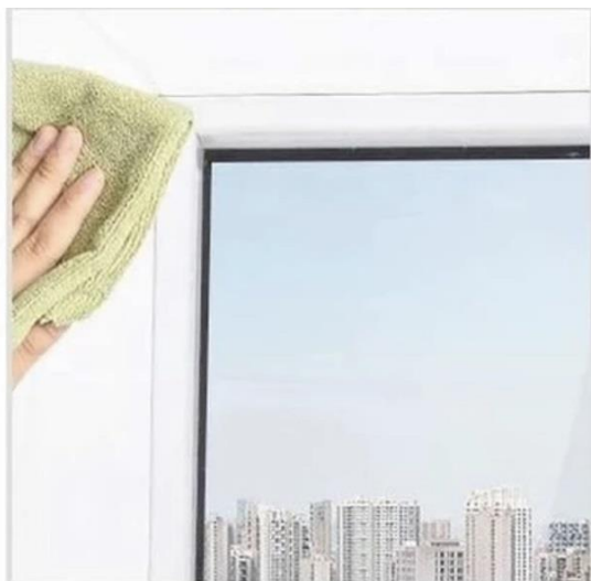
1. Протереть поверхность створки от загрязнений. Поверхность должна быть сухой.